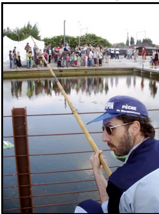
Les voix d'Eau - Lille Bois-Blancs - mai 2009