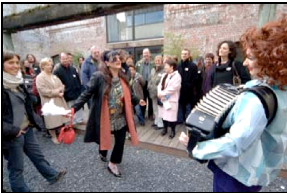
visite détournée – Février 2007 – Roubaix